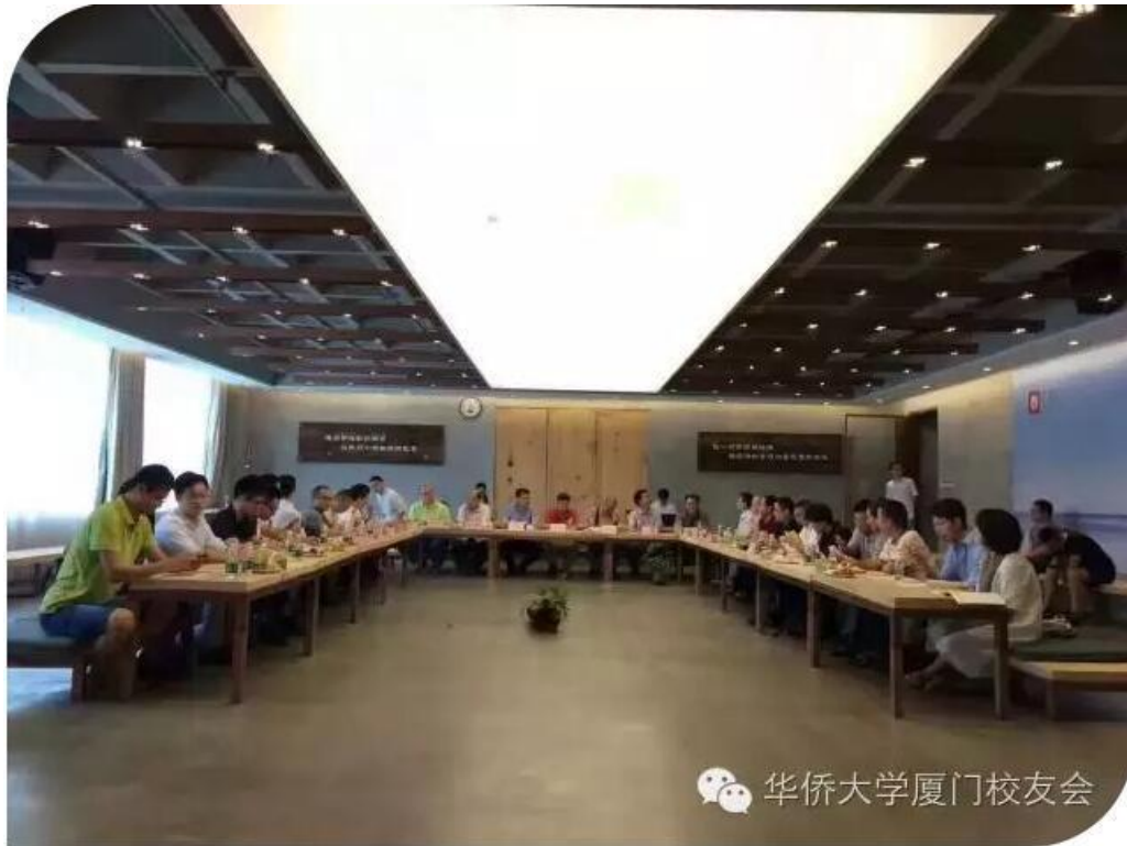
10月30日，在华大56周年校庆到来之际，我校在台师生40余人相聚华大台湾校友会，共贺母校生日，共叙华园情谊。